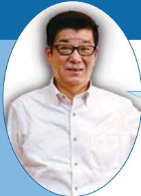
大阪市長 松井一郎

これからの行政は、地域の実情を見て、意見を聴き、施策を実行するニア・イズ・ベターがますます重要になります。