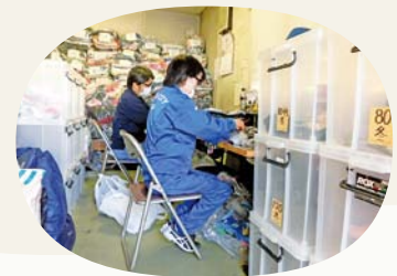
東北環境事業センターで サイズ分けしています!

汚れがなく、リユースできるもの であれば少量でも受け付けます。 ※事前に洗濯などをお願いします。