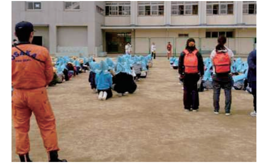
災害等に備え自助力を高める避難訓練

《学校教育目標》 「生きる力」を育む教育活動を推進する 《校 訓》 明るく・正しく・たくましく