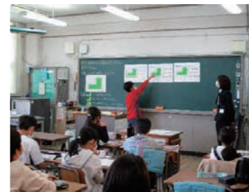
わかるできる授業の実現