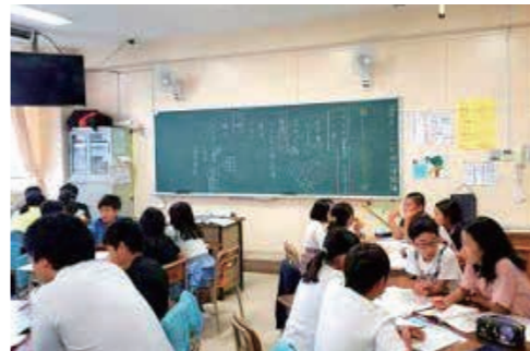
「主体的・対話的で深い学び」のある授業の実現