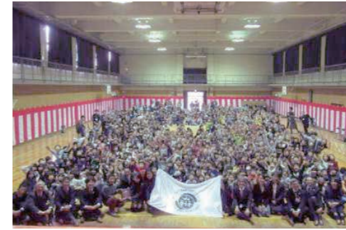
国内8校目となる「セーフティプロモーションスクール認証校」を受賞