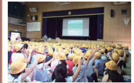
地域・区役所と連携した防災教育