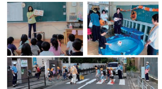
保護者・地域に見守られる学び舎