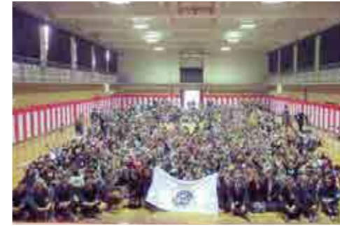
国内10校目となる「セーフティプロモーションスクール認証校」を受賞