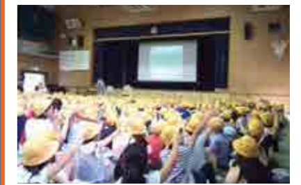
地域・区役所と連携した防災教育