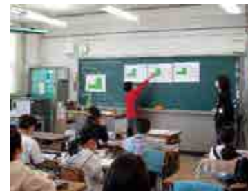
「個別最適な学び」の実現