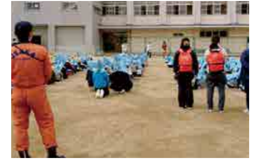
災害等に備え自助力を高める避難訓練

《学校教育目標》 「生きる力」を育む教育活動を推進する 《校 訓》 明るく・正しく・たくましく