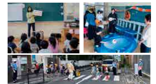
保護者・地域に見守られる学び舎