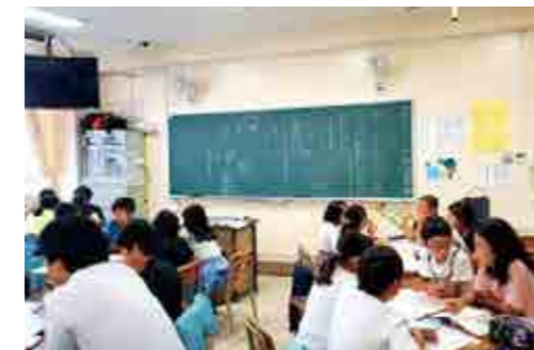
「協働的な学び」のある授業