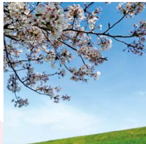
#新北野 #桜 #yodogawatch