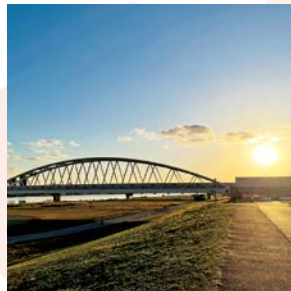
#河川敷 #新北野 #yodogawatch