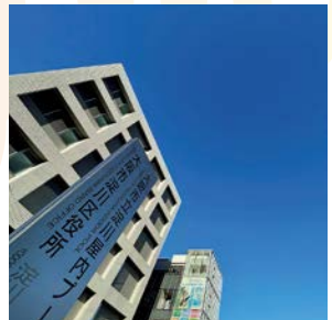
#淀川区役所 #ヨドソラ #yodogawatch