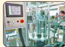
④検査に合格した絵の具をチューブに詰める