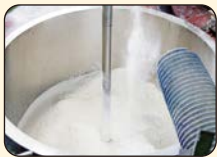
①絵の具の材料を混ぜあわせる