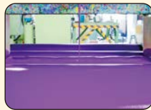
②「ロールミル」という機械で①をなめらかにする