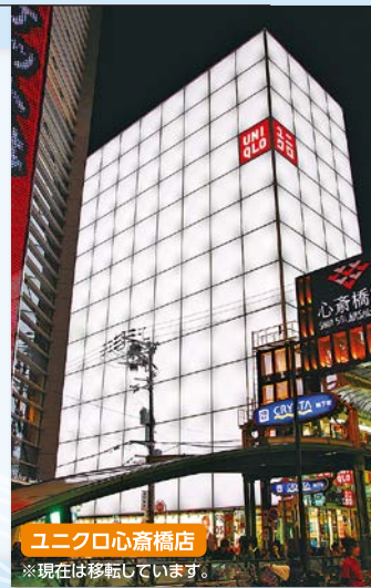
ユニクロ心斎橋店