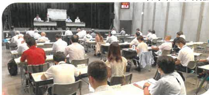
▲ 第1回協議会（全体会）の様子