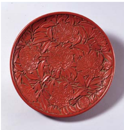
「堆朱牡丹文盆」中国・明時代 大阪市立美術館蔵

中国美術に焦点を当て、館蔵品の中国書画や工芸と、その影響を受けた日本の工芸、仏画、近世・近代絵画などを厳選して展示。中国文化の魅力と広がりをご紹介します。