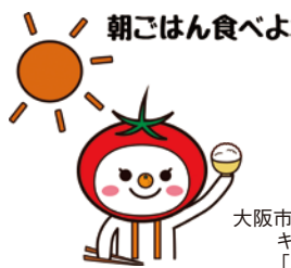
大阪市食育推進 キャラクター 「たべやん」