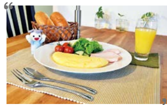
▲ごちそうさまでした!

表紙と巻頭特集で、食べ物の写真をたくさん撮りましたが、写真で「見る美味しさ」を表現するのはホントに難しい。表紙の卵焼きも撮影終了時にはすっかり冷めてしまいましたが、きちんと美味しくいただきました。(広報担当・松本)