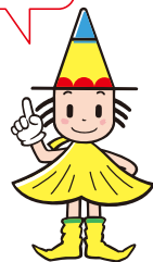
大阪市選挙マスコット「センキョン」