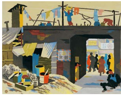
前田藤四郎<盛場近し>1951年大阪中之島美術館蔵

戦後復興期から1970年の日本万国博覧会、そして現代へ至るまで、個性豊かな大都市としての歩みを続ける大阪。その発展と変貌の軌跡を絵画・ポスター・家電・実物大工業化住宅などの作品・資料約300点で紹介します。