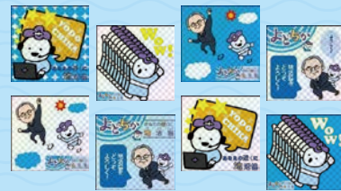
写真はイメージです。実際のデザインとは異なる場合があります。