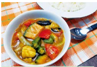
夏野菜たっぷりチキンカレー

材料 5皿分 カレールー …… 1/2箱 鶏もも肉 …… 200g たまねぎ …… 中1個 なす …… 2本 ピーマン …… 2個 かぼちゃ …… 1/4個 オクラ …… 5本 トマト …… 1個 サラダ油 …… 大さじ1 水 …… 指定の分量