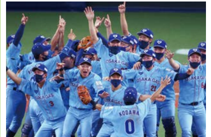
前回優勝チーム: 大阪ガス

全32チームが出場し、社会人野球日本一を決定する最高峰の大会のチケットを500組1,000人にプレゼント。対象は市内在住・在勤・在学の方。詳しくはHPをご覧ください。