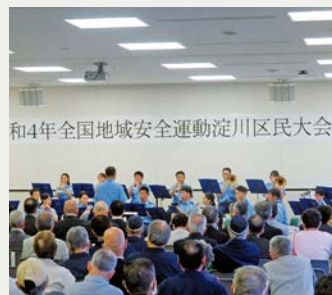
和4年全国地域安全運動淀川区民大会

第1部は防犯功労者表彰や協力企業表彰等の式典、および淀川区住みます芸人「パッハの休日」による防犯漫才や大会宣言を行い、第2部は大阪府警察本部音楽隊による演奏で、区民大会を大いに盛り上げました。