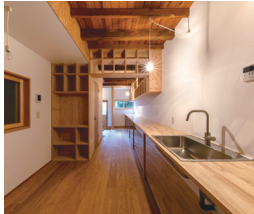
改修イメージ(改修前→改修後)

住宅の性能向上や、子ども食堂・高齢者サロンといった地域まちづくりのために空き家の利活用を予定している方へ、改修に要する費用等の一部を補助します。補助内容など詳しくはHPをご覧ください。