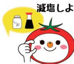
大阪市食育推進キャラクター 「たべやん」

食塩の摂りすぎは循環器疾患やがんとの関連が大きいといわれています。高血圧など生活習慣病予防のために、普段の食生活を見直し、できることから始めてみましょう。簡単な減塩のコツなど詳しくはHPをご覧ください。