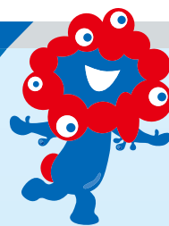
公式キャラクター ミャクミャク

大阪・関西万博の玄関口となる「夢洲駅」が開業します。夢洲駅には、運行ダイヤ図を折り紙で表現した天井や、光のゲートをくぐるような演出の照明があります。ワクワクする近未来的な空間で、来場される方をお迎えします!