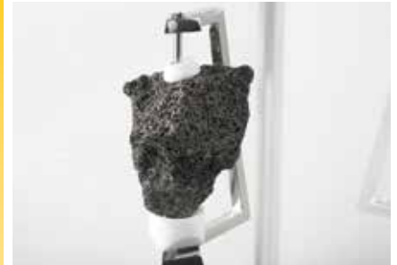
月の石(アポロ15号採取)

1970年の大阪万博で人々が夢見た体験を、当時の記録映像や万博関連資料とともに紹介。前期は万博で使用されたものと同機種の大型コンピュータなど、後期はNASA所蔵の「月の石」の実物や宇宙服などを展示します。