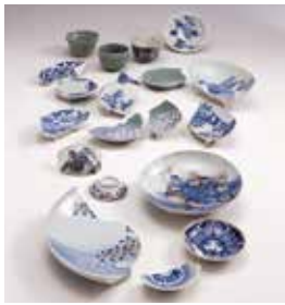
鍋島 江戸時代中期頃(17世紀末~18世紀前葉) 佐賀藩蔵屋敷跡(北区) 大阪市教育委員会蔵

大阪が天下の台所として栄えた江戸時代、年貢米や特産品を販売するために各地の藩が中之島とその周辺に構えた蔵屋敷について、発掘調査成果を中心に展示します。