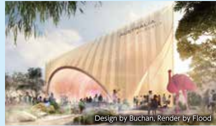
Design by Buchan, Render by Flood

世界的な文化遺産である大理石の彫刻像「ファルネーゼのアトラス」は日本初展示。劇場ではオペラが上演されます。