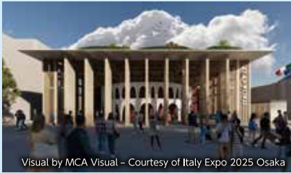
Visual by MCA Visual - Courtesy of Italy Expo 2025 Osaka