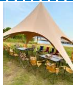
◀▼バーベキュー開催時