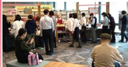
常設ブース「大阪ハートフル商店街」の様子

障がいのある方が手作りした製品を販売する「大阪ハートフル商店街」の出店規模を拡大し、参加・体験・交流をテーマにスペシャル開催。お菓子やアクセサリなどの販売、作品展示や福祉事業所の活動紹介、お楽しみ抽選会など楽しい企画が盛りだくさん。詳しくはHPをご覧ください。