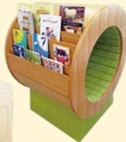
楽しい本棚も たくさん設置!