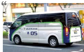
▲大通り以外も走ります。3日前の予約がおすすです。

ついに淀川区でオンデマンドバスの社会実験運行がスタートしました。シティバスよりも小回りがきいて、とっても快適に乗車できますので是非一度お試しください。(広報担当: 宮上)