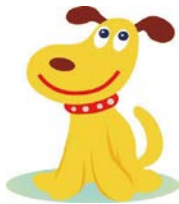
大阪市消費者センター メインキャラクター エルちゃん

「スマホでSNSや動画の広告を見て、1回だけのつもりで商品を購入したが、定期購入契約になっていた」などのトラブルが