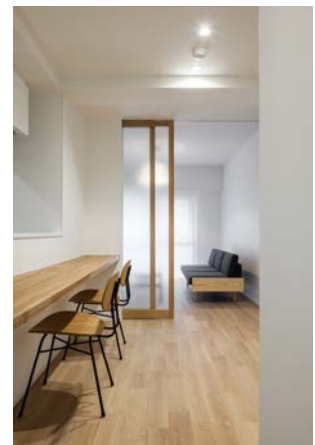
第38回ハウジングデザイン賞 受賞住宅 「LIB MARK minamihorie」

魅力ある良質な集合住宅を表彰する「大阪市ハウジングデザイン賞」を実施。推薦いただいた方の中から抽選で50人に図書カード(500円分)をプレゼント。