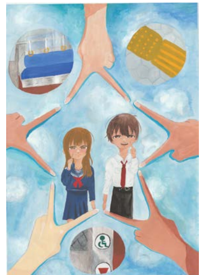
令和6年度 障がい者週間のポスター 中学生部門 最優秀賞作品

障がいのある人とない人との心のふれあいをテーマにした①作文②ポスターを募集。対象は市内在住または在学の①小学生以上②小・中学生。申込方法など詳しくはHPをご覧ください。