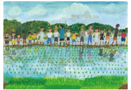
令和7年度 特選(3年生)