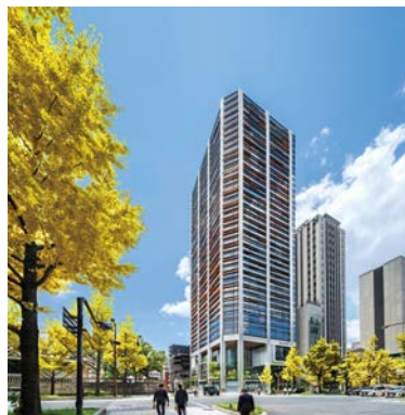
第44回 大阪市長賞：御堂筋ダイビル

周辺環境の向上に資し、かつ景観上優れた建物やまちなみを推薦してください。特に優れたものを表彰します。