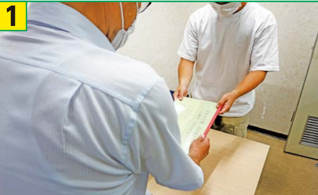
1 地域へ要援護者名簿の提供