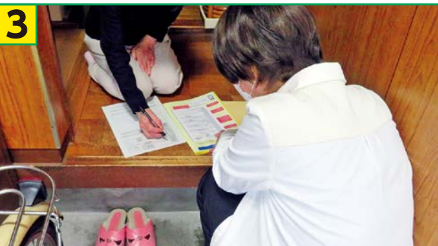
3 訪問時、個別避難計画の項目について要援護者本人に聞き取りしながら作成