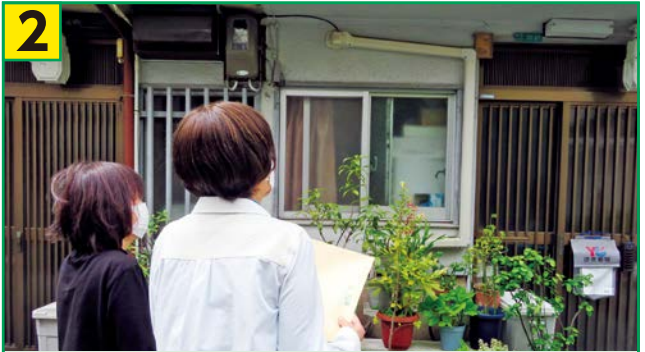
2 地域が要援護者名簿をもとに、日ごろの見守り活動による訪問や安否確認