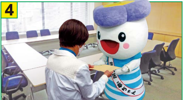
4 完成した個別避難計画を地域で保管及び写しを区役所へ提供