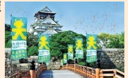
大坂の陣400年プロジェクト