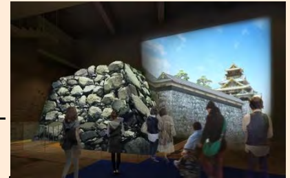
豊臣石垣公開施設イメージ

※PMO...公園の一体的なマネジメントを行う民間事業者 (26補正 1億6,700万円)