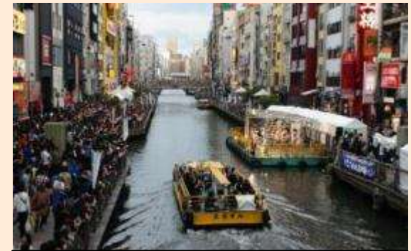
水都大阪2015プレイベントの様子