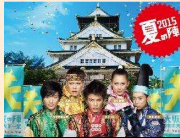
大坂の陣400年天下一祭