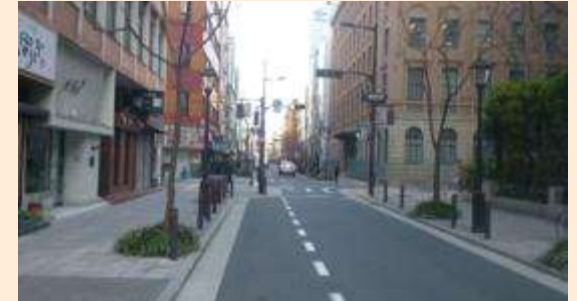
電線が地中化された三休橋筋の様子