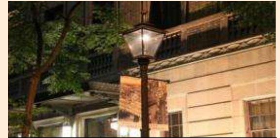
明かりが灯る三休橋筋のガス灯