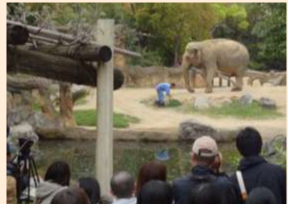
ゾウのお祝い会 ～ケーキのプレゼント～