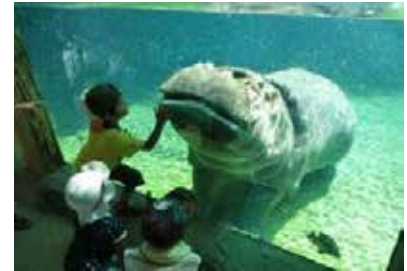
水中の行動を観察できるカバプール