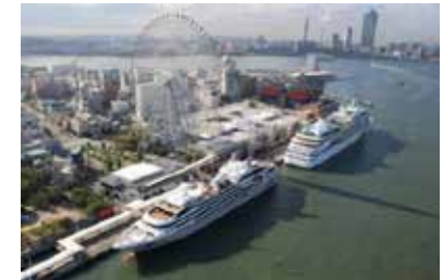
天保山岸壁に入港する客船