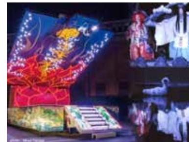
芸術文化魅力育成プロジェクト