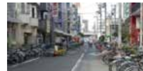
通行を妨げている迷惑駐輪