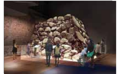
豊臣石垣公開イメージ