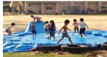
27年度プレーパークモデル事業開催風景 (平成27年8月20日～9月30日:もと津守 小学校・幼稚園) 延べ1460人が参加