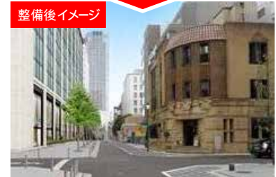
無電柱化された道路整備後のイメージ(芝川ビル周辺)