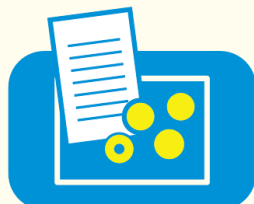
トレイでの 金銭やりとり